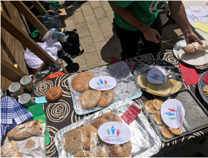
Auzoak Abian: Trabajo comunitario en calle (Panes del Magreb)