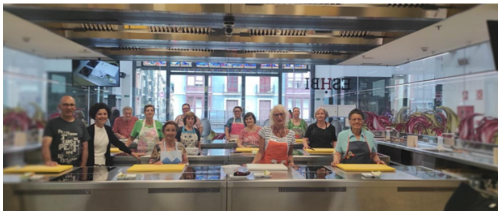
Taller de Cocina con Cáritas.