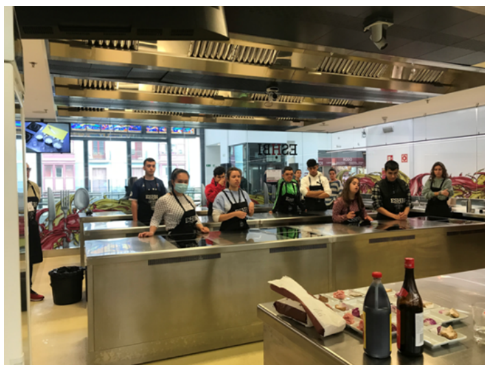
Taller de cocina con adolescentes del Aula Estable.