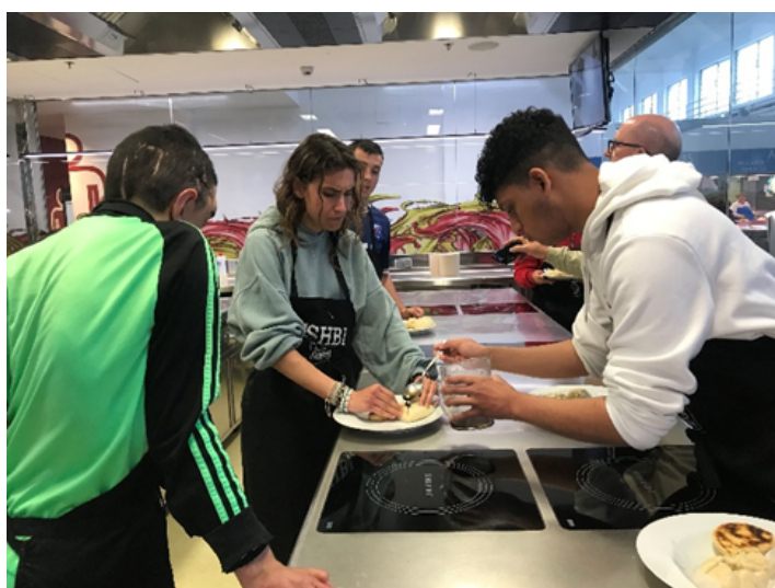
Taller de cocina con jóvenes de Izangai.