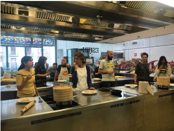
Taller de cocina con comunidad "Tejiendo Salud"